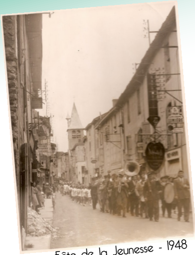
Fête de la Jeunesse - 1948